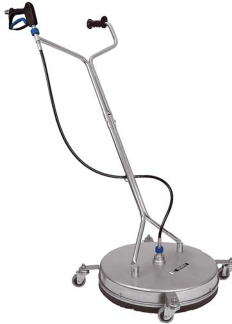
FL-CR 520 / FL-CRY 520